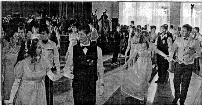
Осенний бал: классическую музыку исполняет Губернаторский оркестр.