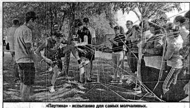
«Паутина» - испытание для самых молчаливых.