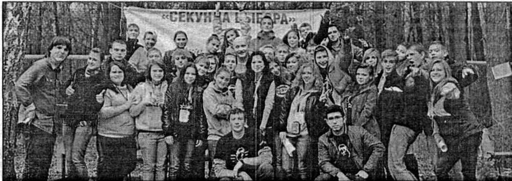
Участники школы студенческого профсоюзного актива для первокурсников «Секунда выбора»-2012.